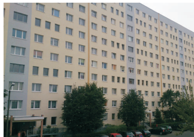
Ocieplona elewacja frontowa budynku przy ul. Wrocławskiej 21-31.

Właśnie zakończyły się prace na budynkach przy ul. Wrocławskiej 21-31 w Jastrzębiu-Zdroju, na os. Gwarków 28 w Żorach i przy ul. G. Morcinka 17B w Kaczycach.