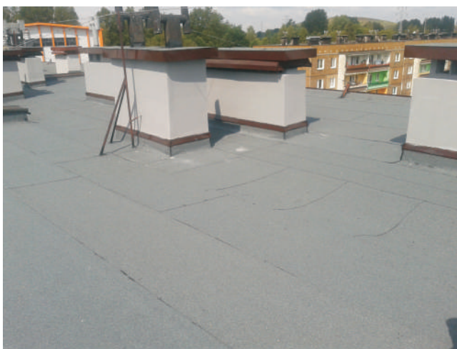
...i na os. 1000-lecia 23-24.

Zgodnie z planem remontów w bieżącym roku przeprowadzono remont instalacji wody w czterech budynkach – przy ul. Małopolskiej 1-19, Małopolskiej 21-39, Małopolskiej 41-59, Małopolskiej 101-119 w Jastrzębiu-Zdroju. Podczas remontu okazało się, że część lokatorów już wcześniej dokonała wymiany instalacji na własny koszt.