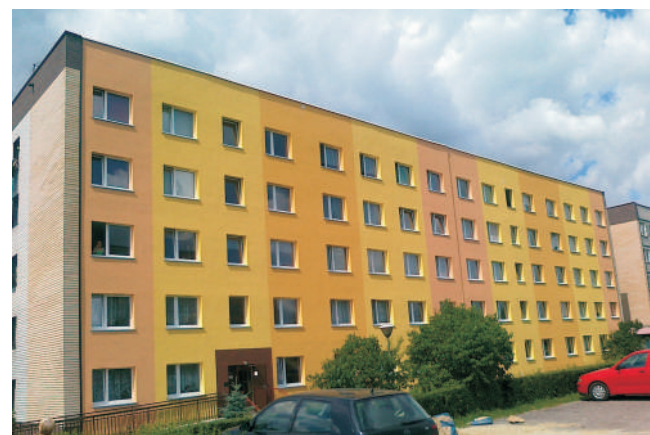
i przy ul. G. Morcinka 17B w Kaczycach.

Efekt tych prac cieszy oko nie tylko lokatorów tych budynków, ale również wszystkich mieszkańców miasta.