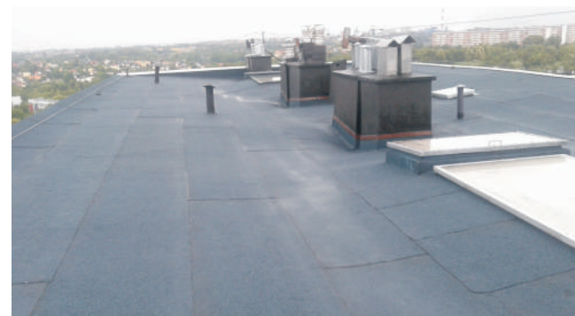
Nowe poszycie dachu budynku ul. Wrocławskiej 21-31...